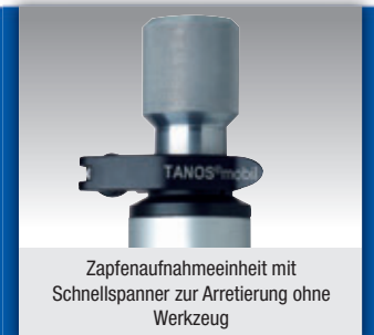
Zapfenaufnahmeeinheit mit Schnellspanner zur Arretierung ohne Werkzeug