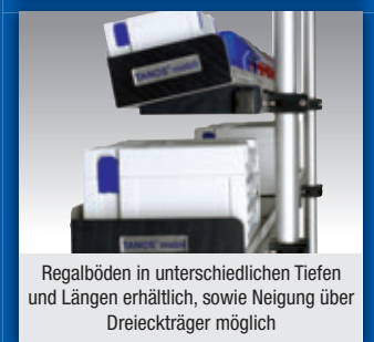
Regalböden in unterschiedlichen Tiefen und Längen erhältlich, sowie Neigung über Dreiecksträger möglich