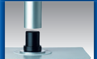
Adaption am Fahrzeugboden über selbstklebenden Flausch, Klettmatte mit Zapfen, Bodensteckteil und Distanzrohr