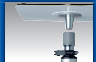
Adaption am Fahrzeugdach über selbstklebenden Flausch, Klettmatte mit Zapfen, Distanzrohr und Zapfenaufnahmeeinheit